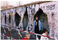
Was "Mauerspechte" übrigließen, Berlin, Januar 1990, Foto: Jürgen Lottenburger, Quelle: Deutsche Kinemathek